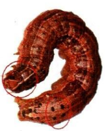
تصویر نمبر 2: گہرے رنگ کا سر اور سائے کی طرف