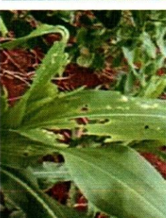
تصویر نمبر 1: مٹی کے پتے پر نقصان کی علامات