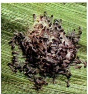
تصویر نمبر 3: انڈوں سے نکلنے والی مٹیوں